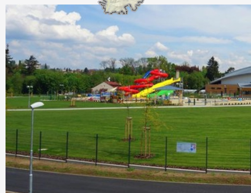
Sportovní a rekreační areál Maškova zahrada Turnov hlavní cena v roce 2016

V minulých letech byla ještě udělována další ocenění - Zvláštní cena předsedy poroty, Zvláštní cena poroty a Cena hejtmana Libereckého kraje.